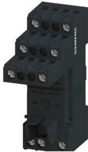
STECKSOCKEL FUER PT- RELAIS 2 WECHSLER, MIT LOGISCHER TRENNUNG