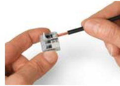
Leiter anschließen: Klemmstelle durch Betätigungshebel öffnen und Leiter einführen.