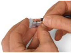
Leiter 11 mm abisolieren.