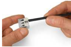
Hebel in Ruhelage zurückführen.