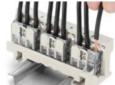
Lösen der Leiter im Befestigungsadapter