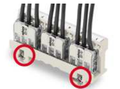
Einbauweise 275 V Schraubbefestigung des Adapters mit leitfähiger Schraube