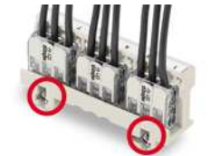
Einbauweise 440 V Schraubbefestigung des Adapters mit nichtleitfähiger Schraube