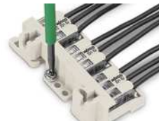
Einbauweise 440 V Liegende Schraubmontage auf glatter Oberfläche