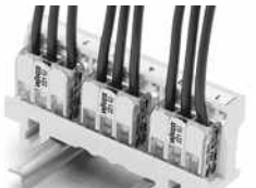
Einbauweise 440 V Senkrechte Montage auf Tragschiene 35