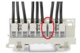
Einbauweise 275 V Positionierung der Klemmen im Adapter ohne Distanzelement zwischen Klemmen