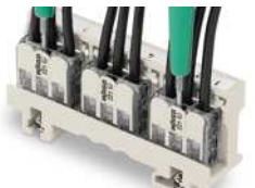
Prüfen der Klemmen einfach gemacht – auch im eingelezten Zustand Die Einbauweise ist dafür nicht relevant.