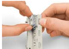
Lösen der Verbindungsklemme aus dem Befestigungsadapter