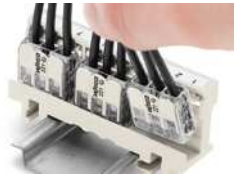
Einrasten der Klemmen in den Befestigungsadapter