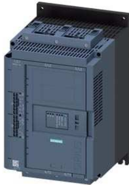
SIRIUS Sanftstarter 200-600 V 93 A, AC 110-250 V Federzugklemmen Analogausgang