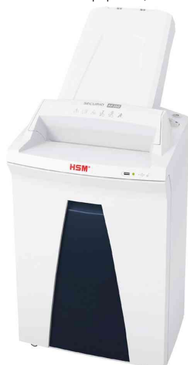
Aktenvernichter SECURIO AF350

0,78 x 11 mm : détruit le papier et, en cas d'alimentation manuelle, les agrafes/trombones