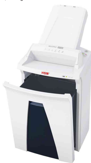
Detailansicht: herausnehmbarer Auffangbehälter