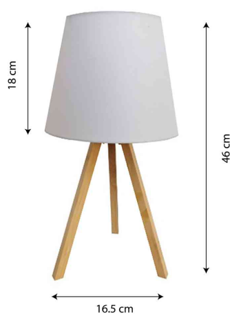
Vue détaillée: dimensions