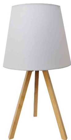
Lampe de table à LED KATY