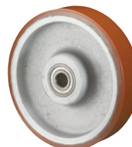
Vulkolan • sehr hohe Belastbarkeit • extrem abriebfest • bodenschonend • geräuscharmer Lauf • hoher Fahrkomfort • weitgehend beständig gegen Öle, Fette, Benzine sowie eine Vielzahl von Chemikalien