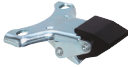
Richtungsfeststeller • Blockierung der Schwenkbewegung