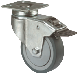
Totalfeststeller • Blockierung von Gabelkopf und Rad