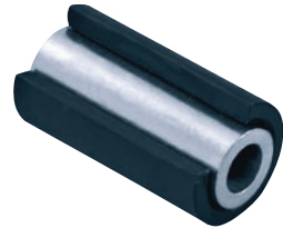
Gleitlager • Speziell für: gelegentlichen Einsatz oder Nassbetrieb • Lager-Bauart: beständig gegen Korrosion