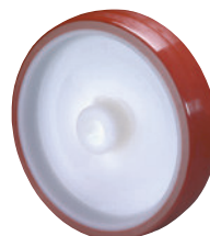
TPU (thermoplastischer Polyurethan) • robust und abriebfest • kontaktverfärbungsfrei • bodenschonend • geräuscharmer Lauf • weitgehend beständig gegen Öle, Fette, Benzine sowie eine Vielzahl von Chemikalien