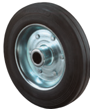
Vollgummi • geräuscharmer Lauf • bodenschonend • stoßfest • vibrationsdämpfend