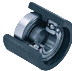
Kugellager • Speziell für: Schwerlast-Rollen • Rollwiderstand, Tragfähigkeit: erfüllt höchste Anforderungen