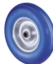
Pannensichere Räder (Polyurethan-Bereifung) • abriebfest • stoß- und geräuschkämpfend • langlebig • wartungsfrei • hohe Tragkraft