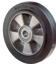
Elastik-Vollgummi • hohe Belastbarkeit • extrem abriebfest • ausgezeichneter Fahr- und Bedienungskomfort