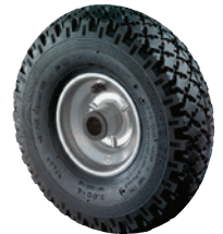
Luft • gute Stoßdämpfung • geringer Rollwiderstand bei Einsatz auf schlechten Böden