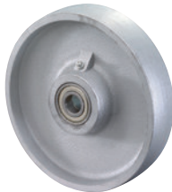
Guss • hohe Tragfähigkeit • abriebfest • unempfindlich gegen Metallspäne und aggressive Stoffe