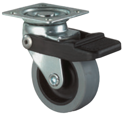
Radfeststeller • Blockierung des Rades

Verschiedene Modelle für einen sicheren Stand.