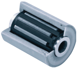
Rollenlager • Rollwiderstand: gering auch bei hohen Lasten • Ausführung: widerstandsfähig, robust • Weitgehend wartungsfrei

Leichtgängige Modelle in großer Auswahl.