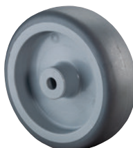
TPE (thermoplastischer Gummi) • hoher Fahrkomfort • geräuscharmer Lauf • spurlos (Werkstoff ist aber ölhaltig und kann bei empfindlichem Untergrund zu Kontaktverfärbungen führen) • geringer Rollwiderstand