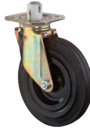
Zentralfeststeller • Schaltung der Rollen von einer Stelle aus