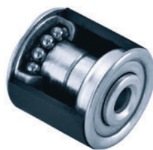
Konuskugellager • Speziell für: Apparate-Rollen • Lagerlauf: leicht