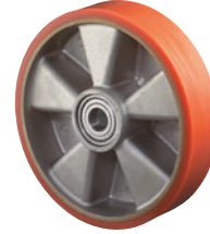
Polyurethan • hohe Belastbarkeit • robust und abriebfest • elastischer, geräuscharmer Lauf • weitgehend beständig gegen Öle, Fette, Benzine sowie eine Vielzahl von Chemikalien