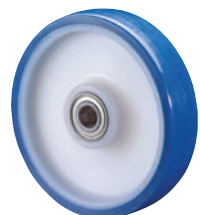
Santoprene • hohe Belastbarkeit • robust und abriebfest • extrem geräuscharmer Lauf