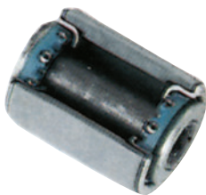
Freewaylager • Lauf: ruhig und präzise • Ausführung: verschleißfest, korrosionsbeständig