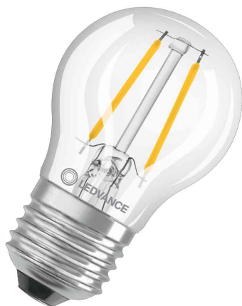
Visuel de référence: Lampe LED CLASSIC P, culot E27