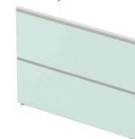
Accessoire: panneau latéral N:\VivalP\Koepe\56917\3399.jpg