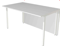
2) Élément de table, 2 côtés, droit N:\VivalP\Koepe\56917\3394.jpg