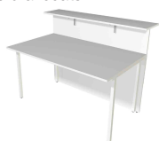
1) Comptoir, 2 côtés, droit N:\VivalP\Koepe\56917\3456.jpg