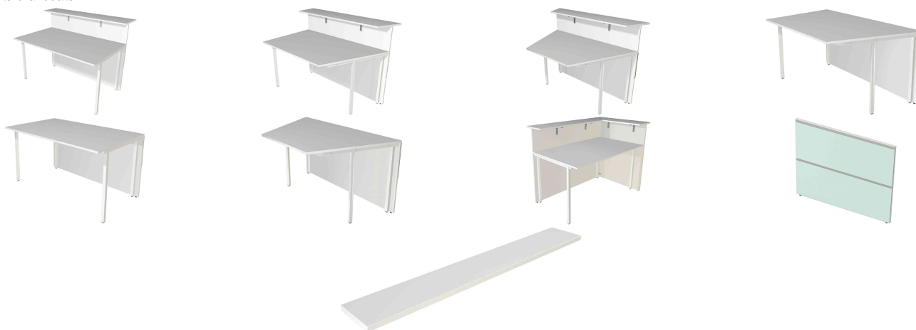
Accessoire: support p Acc Accessoire: support pour sacs