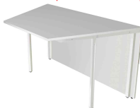
2) Élément de table, 2 côtés, droit N:\VivalP\Koepe\56917\3396.jpg