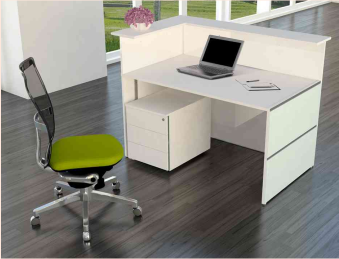
Illustration: Comptoir d'accueil Atlantis