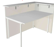
3) Élément d'angle, ouvert d'un côté N:\VivalP\Koepe\56917\3288.jpg