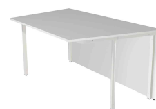
2) Élément de table, 1 côté, oblique N:\VivalP\Koepe\56917\3395.jpg