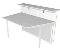
1) Comptoir, 1 côté, oblique N:\VivalP\Koepe\56917\3289.jpg