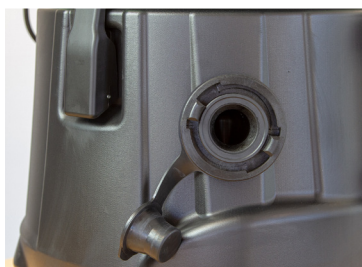
C- Rohr Anschluss für Abwasser