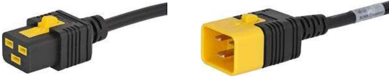
IEC Gerätesteckdose C19 V-Lock Verriegelung schwarz

IEC Netzweiterverbindungsleitung mit IEC Gerätesteckdose C19, V-Lock, gerade