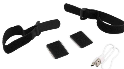
Accessoire : matériel de fixation