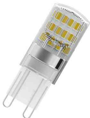
Visuel de référence: Ampoule LED PIN DIM, G9

Exemples d'utilisation: - pour des effets lumineux d'ambiance dans les pièces à vivre ou une salle de réception - convient également pour magasins, foyers ou bureaux