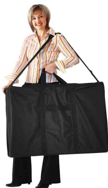
Visuel de référence: sac de transport