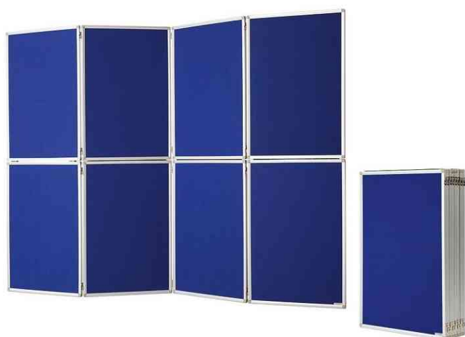
Tableau de présentation, bleu