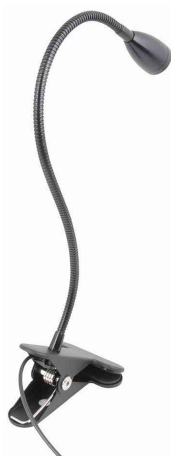
Lampe LED avec pince de serrage SNOKE