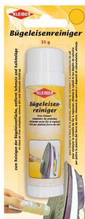
Détachant pour fer à repasser

Ne pas inhaler les vapeurs qui se dégagent ! Veuillez respecter les instructions du fabricant de l'appareil. Conservez le produit avec le mode d'emploi.