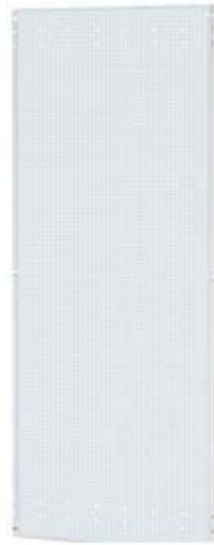
SIVACON SICUBE MONTAGEPL. HINT. HXB 1800X1000