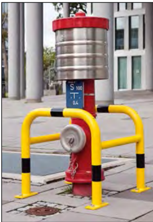
Perfekter Rumdumschutz, Rohrdurchmesser 60/48 mm