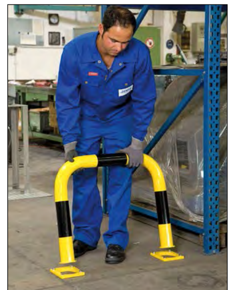
Anwendungsbeispiel, zum Wegnehmen.