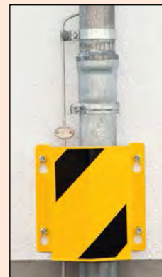
Zum Schutz von (Fall-)Rohren, Leitungen, Kabelsträngen usw.