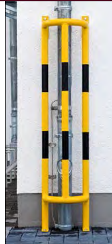
Gütestahlbügel in halbrunder Form zum Schutz gegen Anfahrsschäden, Rohrdurchmesser 48 mm