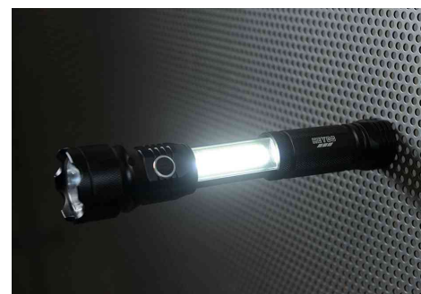
Visuel de référence: Montre l'utilisation de l'éclairage complémentaire