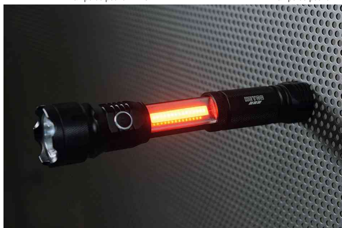
Visuel de référence: Montre l'utilisation du signal lumineux