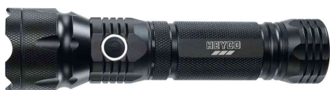
Lampe de poche LED 3 W