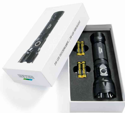
Lampe de poche LED 3 W, dans son emballage