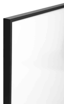
Vue détaillée : cadre