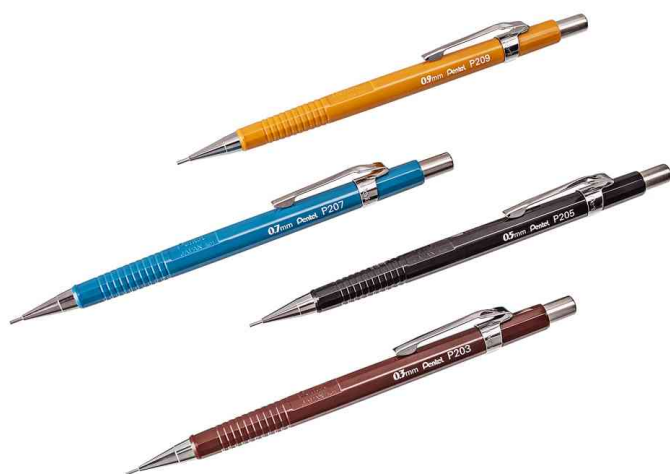
Visuel de référence: Porte-mines série P200