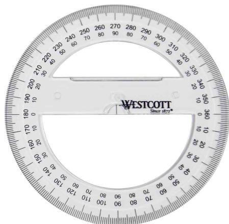
Rapporteur circulaire 360 degrés, 100 mm