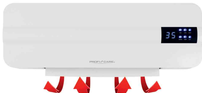
Vue détaillée : fonction swing activable