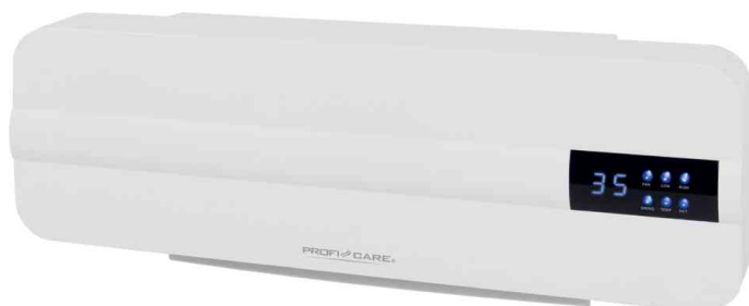
Chauffage mural en céramique PC-HL 3116