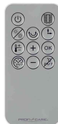
Vue détaillée : télécommande