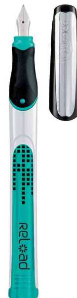
Stylo plume Reload, vert