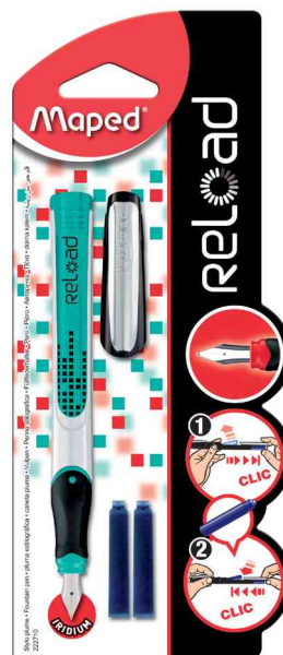
Stylo plume Reload, vert