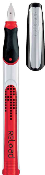
Stylo plume Reload, rouge