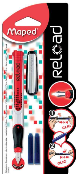
Stylo plume Reload, rouge