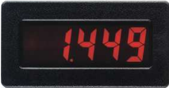
CUB 4V/CUB 4I in Originalgröße

Die CUB4 Volt- und Amperemeter besitzen eine 15 mm hohe brillante LCD-Anzeige. Die Anzeige ist als Standard-LCD oder rot bzw. grün-gelb hintergrundbeleuchtet lieferbar. Über DIP-Schalter kann ein Dezimalpunkt frei gesetzt werden. Die Geräte können skaliert werden, um das Eingangssignal direkt in eine andere Größe umzuwandeln, beispielsweise in Druck, Durchfluß, rel. Feuchte, etc. CUB4V und CUB4I sind wirtschaftliche Digital-Volt- bzw. Amperemeter mit großer Anzeige, die durch ihre hohe Schutzart IP65 im rauen Industriebetrieb eingesetzt werden können.