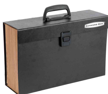
Trieur accordéon Handilife