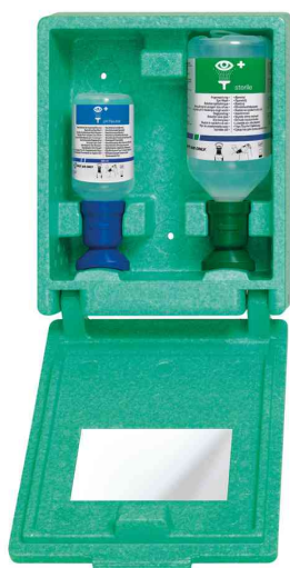
Station d'urgence oculaire