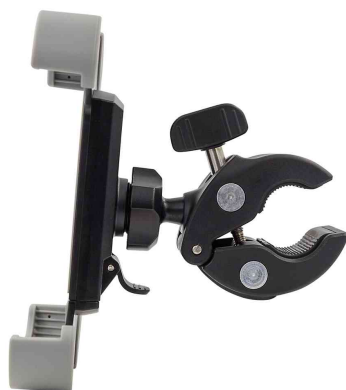
Support pour smartphone pour vélo "Clip it bike", vue de côté