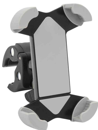
Support pour smartphone pour vélo "Clip it bike"