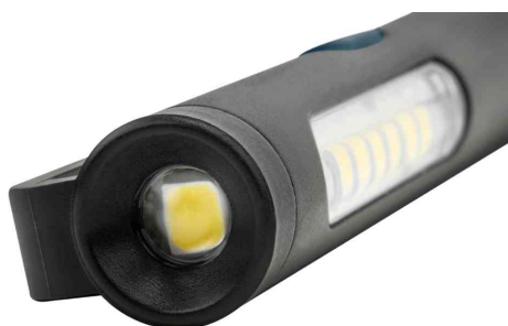
Projecteur auxiliaire sur la tête de lampe