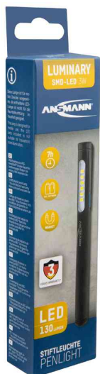
Lampe stylo professionnelle à LED PL130B, emballage