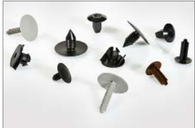
Blindstopfen sind in verschiedenen Formen und Materialien erhältlich.