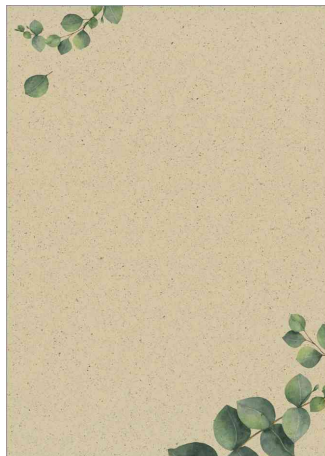
Papier Design "Eucalyptus"