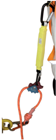
1292_1486_MEWP in 1,1 – 1,8 m Länge