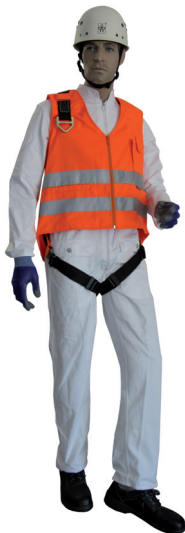
Auffanggurt mit Warnweste