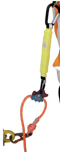
Auffanggerät angeschlagen an der rückwärtigen Auffangöse des Auffanggurt