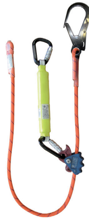
1292_1483_MEWP in 1,1 – 1,8 m Länge

Kennzeichnung: Das Auffanggerät ist zusätzlich mit dem Kennzeichen: geeignet für Hubarbeitsbühnen gekennzeichnet.