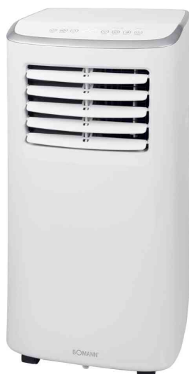
Climatiseur CL 6061 CB