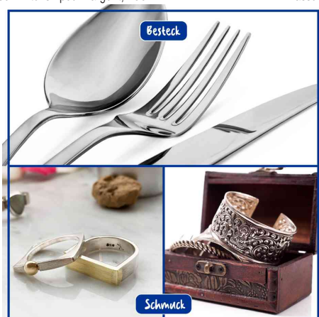
idéal pour les couverts et les bijoux