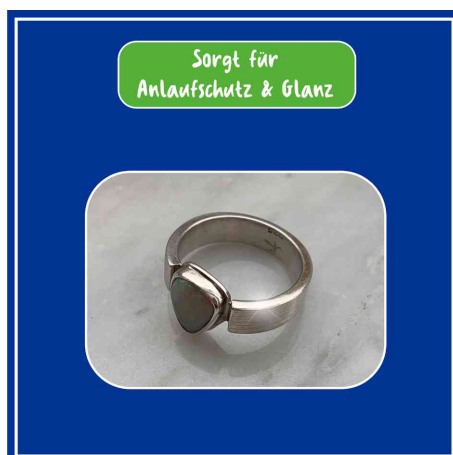
assure la protection contre la ternissure - fait briller