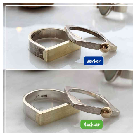
avant - après