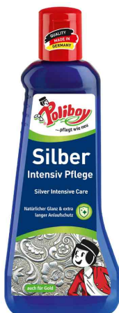
Soin intensif pour l'argent, 200 ml