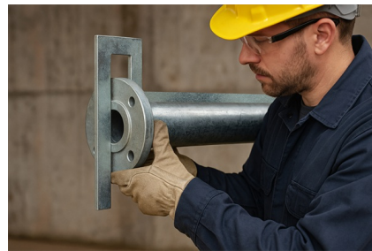
Exaktes Ausrichten von Flanschplatten am Rohrende.