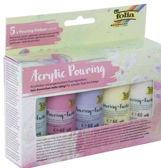
Peinture acrylique pour pouring - couleurs pastel