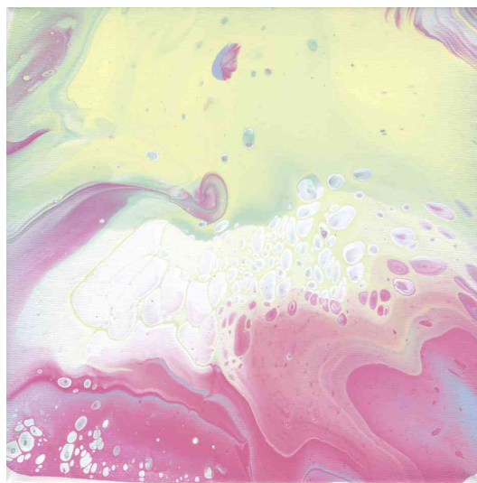
Visuel de référence: Montre le produit en utilisation (pastel)