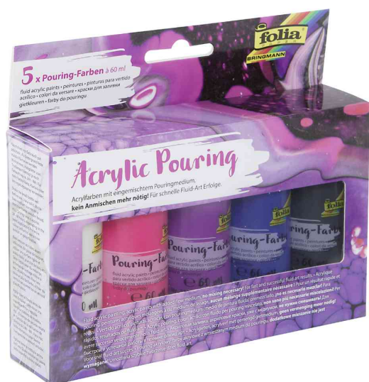
Peinture acrylique pour pouring - couleurs intenses