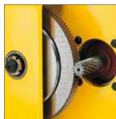
Getriebe mit Rutschkupplung