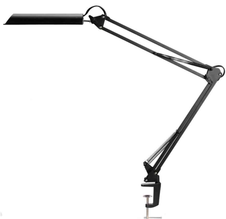
Lampe de bureau à LED SWINGO, noir, pince