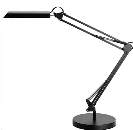
Lampe de bureau à LED SWINGO, noir, socle