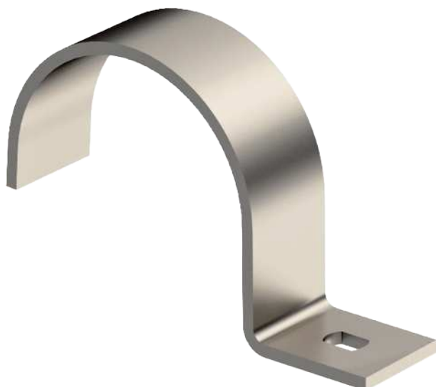
Befestigungsschelle einlappig 50mm