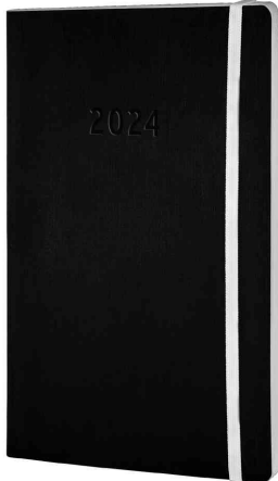
Chronobook "Black & White Edition", schwarz

Innenausstattung: Tages- oder Wochenplan • Jahresplan • Jahresübersicht Folgejahr • Notizblätter • Übersicht Feiertage • Ferienplan