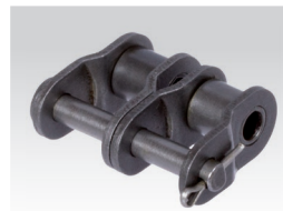
Nr. 12/L: gekröpftes Glied mit Splintverschluss