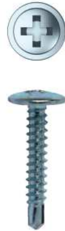
Imagen de producto/ Product picture