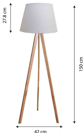
Vue détaillée: dimensions