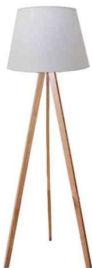
Lampadaire à LED TOOKA