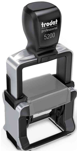
Textstempel Professional 4.0 5200

Zubehör: Ersatzstempelkissen: Abgabe nur in ganzen VE's