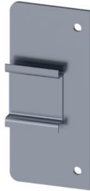
Hutschienen-Erweiterung für N/PE-Klemme