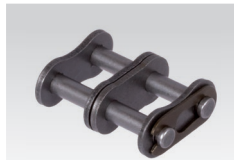
Nr. 11/E: Steckglied mit Federverschluss Nr. 10/S: Steckglied mit Splintverschluss