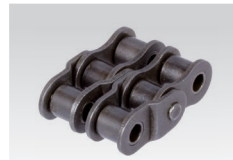
Nr. 15/C: gekröpftes Doppelglied