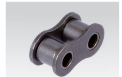
Nr. 4/B: Innenglied (2 Stück erforderlich)

Bestellangaben: z.B.: Artikel-Nr. 120 003 00, Verschluss Nr. 11/E, 05 B-2