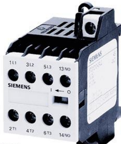
MOTORSCHUETZ EKS 3S+1OE GLEICHSTROMBETAETIGUNG DC 24V