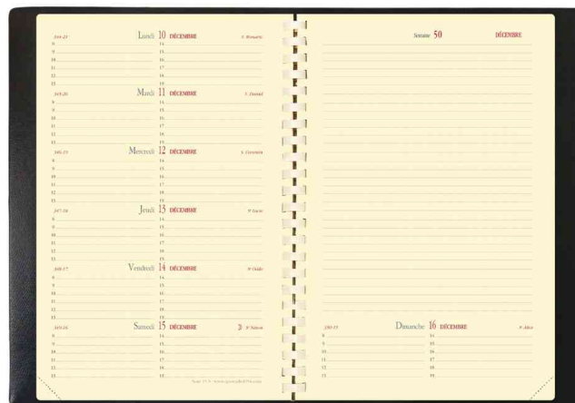
Agenda de poche "Affaires Prestige" - grille