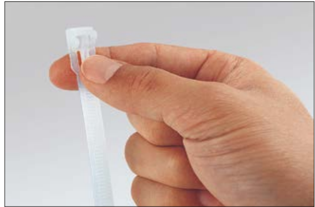
REL-serie hersluitbare bundelbanden.