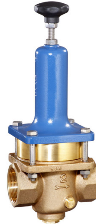
DN 32 - DN 50