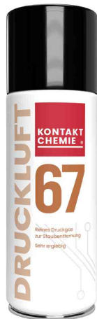
Druckluftreiniger "DRUCKLUFT 67"